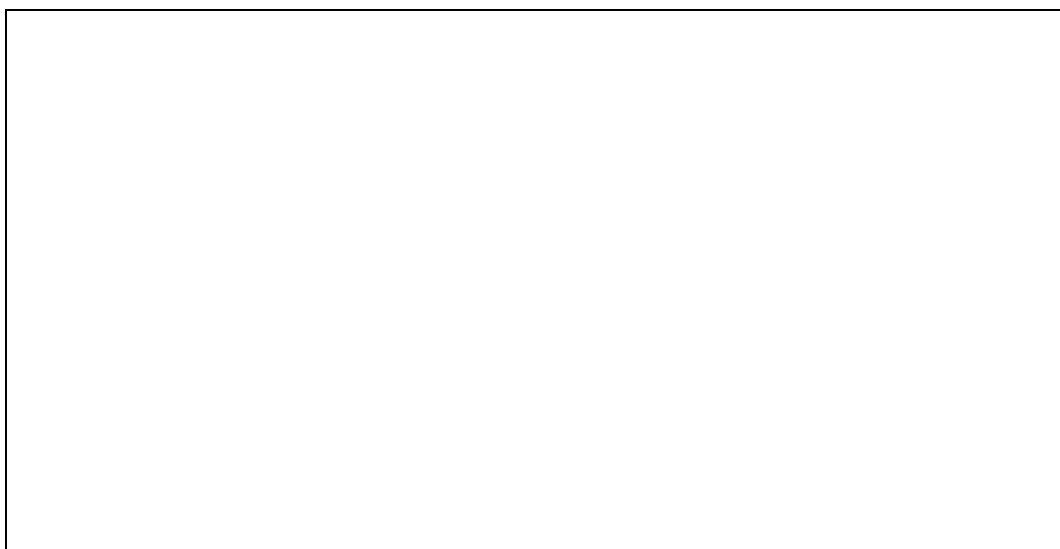
Une structure de production de l'Agence du cannabis

L'Agence est basée sur la vente de cannabis dans des points de vente (« Cannabistrots ») autosuffisants, ayant leurs propres installations de production de cannabis contrôlé, pour assurer un circuit d'approvisionnement le plus court possible et éliminer le risque que le cannabis quitte ce circuit fermé.